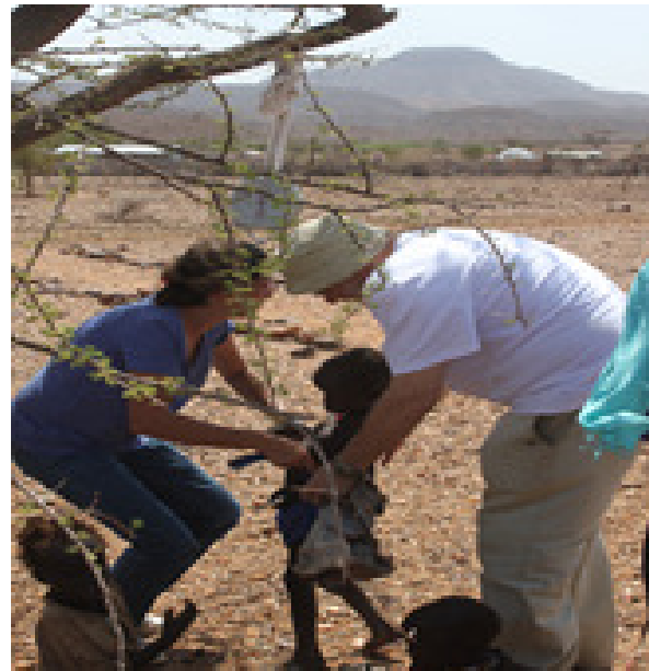
Evaluando el estado nutricional de niños de las escuelas preescolares en Turkana, (Kenia) que financia la Fundación